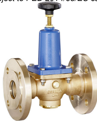
DN 40 - DN 50