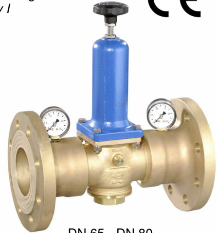
DN 65 - DN 80

(Ausführung DN 65 & 80 mit separaten Manometeranschlüssen / version DN 65 & 80 with separate manometer connections)