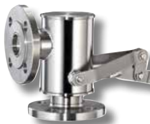
ESV 80 F/F

Für beide Ventile, wie für unser gesamtes Sortiment, können wir eine hohe Verfügbarkeit und somit kurze Lieferzeiten zusagen.