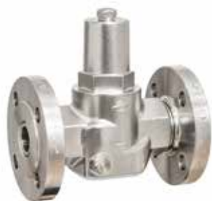
DRV 832-D • DRV 838-D Bauform A (DN 15 - DN 32)