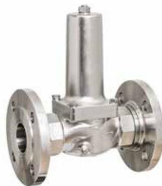
DRV 832-D • DRV 838-D Bauform B (DN 40 - DN 50)