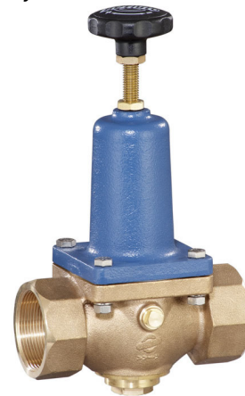
DN 40 - DN 50 (DRV 302-6)