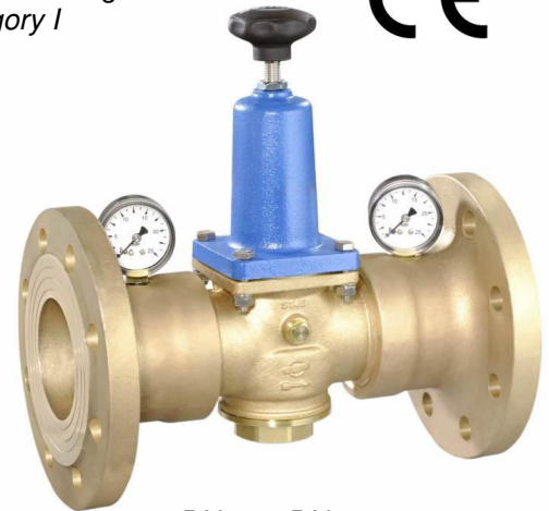
DN 65 - DN 80

(Ausführung DN 65 & 80 mit separaten Manometeranschlüssen / version DN 65 & 80 with separate manometer connections)